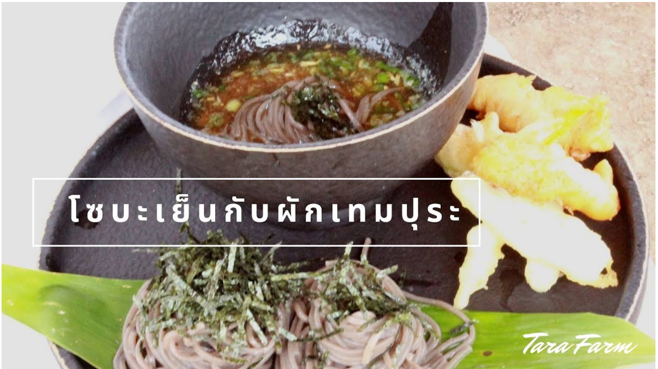
โซบะเย็นกับผักเทมปุระ