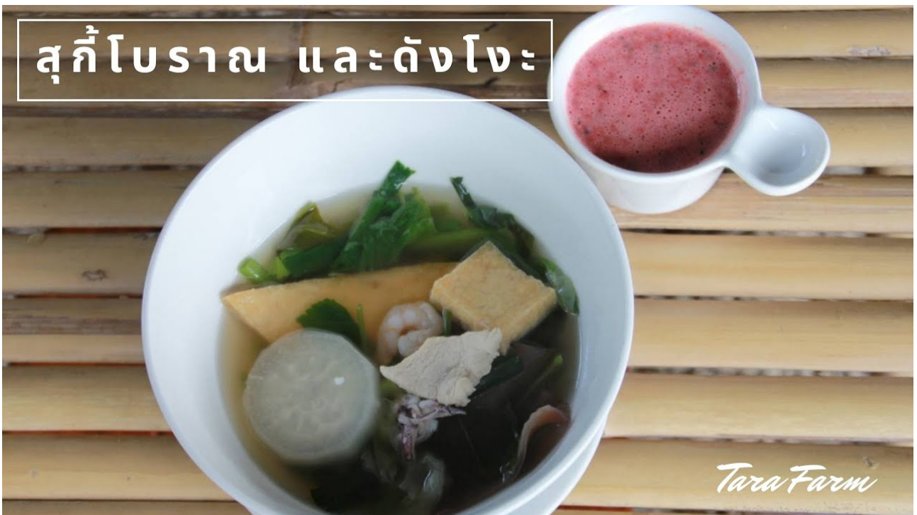
สุกี้โบราณ และดงโงะ